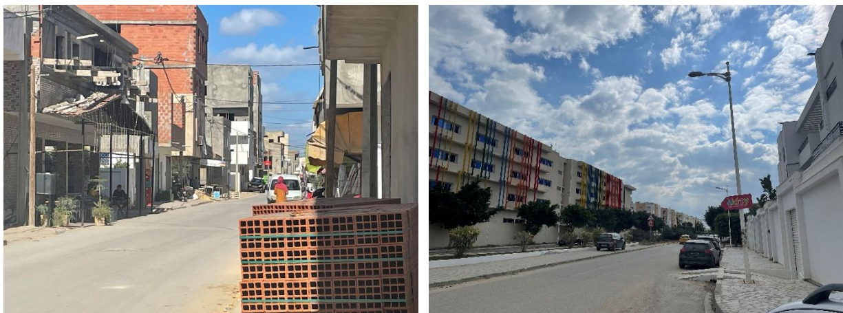
Figure 2 : contraste entre quartier chic et quartier bhar lazrak-fracture socio-spatiale

Rattaché à la Marsa, commune prisée par la bourgeoisie Tunisoise, Bhar Lazrak incarne une urbanité dissonante où les contrastes sont saisissants entre deux « mondes » urbains juxtaposés : d'un côté, Bhar Lazrak avec ses formes d'habiter populaires, ses rues non asphaltées, ses constructions évolutives, ses réseaux d'assainissement précaires et l'absence de services publics structurés. de l'autre côté, les quartiers avoisinants avec des tissus pavillonnaires de villas luxueuses, de cités résidentielles de haut standing, et équipements structurés (figure 2). Cette proximité géographique entre deux formes d'urbanité crée une tension permanente dans le paysage urbain et induit une fracture socio-spatiale persistante .